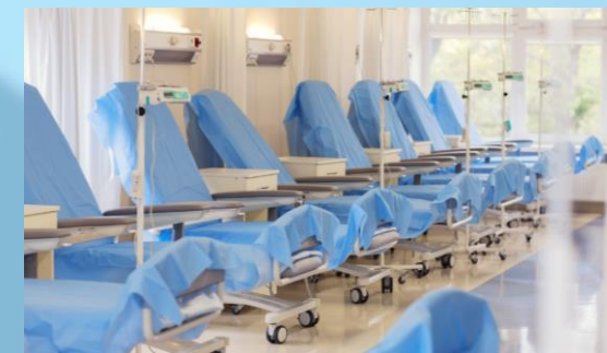
Pododdział Chemioterapii Jednego Dnia w szpitalu im. M. Kopernika